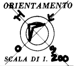
PLANIMETRIA 1:1000 - FOGLIO 135.